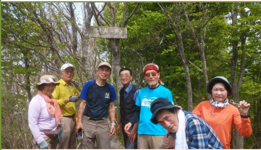
傾斜が少しきつかったが「檜木森山」山頂到着。お疲れさま！

シラネアオイやイカリソウ等、春の花が賑やかでした。カタクリの花は終わりに近づいていましたしたがツツジが膨らみ始めています。