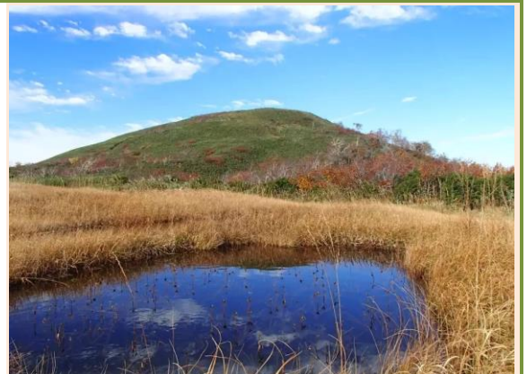
白神山地の東端、青森県との県境近くに位置する。

山頂には田代山神社が祭られている。眺望は隣接する藤里駒ヶ岳や白神の山々、岩木山、森吉山、八甲田山、男鹿半島まで見渡せ、実に雄大である。