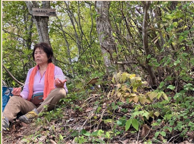
少し下ったところの鉄塔まで下りて、お待ちかねの昼食タイム

シラネアオイやイカリソウ等、春の花が賑やかでした。カタクリの花は終わりに近づいていましたしたがツツジが膨らみ始めています。