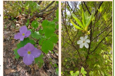
春の花が賑やかで楽しい！