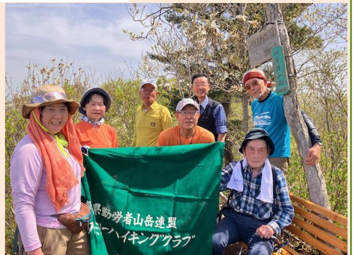
山頂には可愛いベンチが一つ置かれている