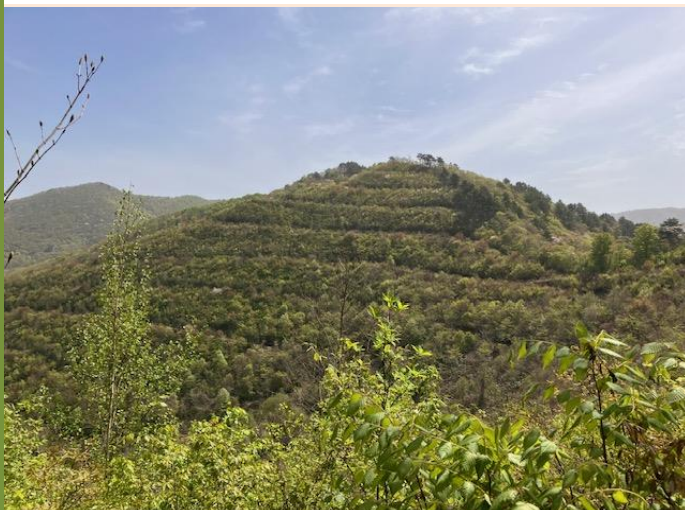
木材伐採用の道をトラ刈り頭に例え「バリカン山」