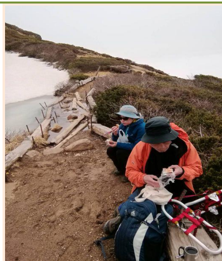
鏡沼まで下り昼食休憩