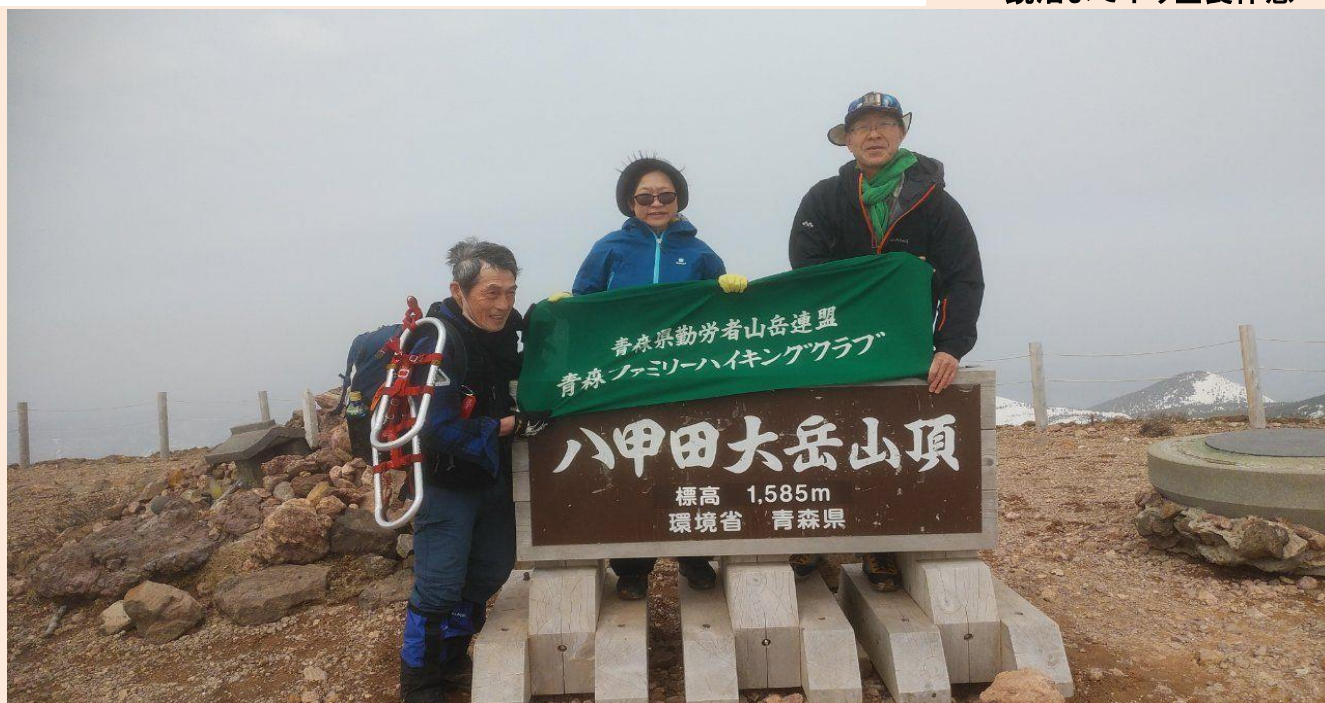
山頂には雪はなく記念写真