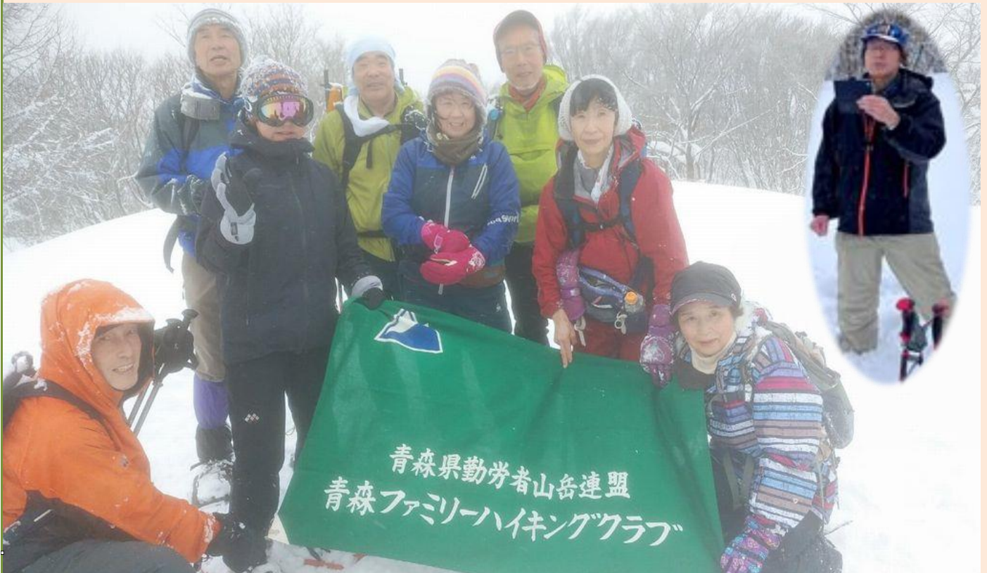
梵珠山頂上、積雪2.5m、気温零度以下