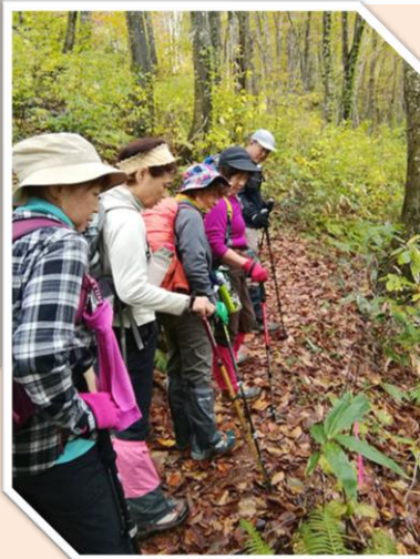
下を見れば色んな山野草やお花が・