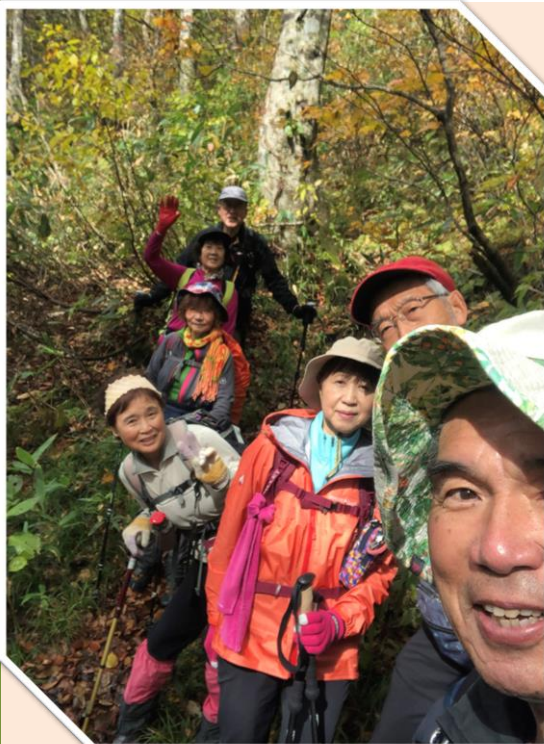
急登を登り小休止

写真撮影して、景色も見えたけど風がありまして、早々に降りて昼食は風が無い、広めの黄色のブナ林で丸くなり、下界の野辺地町を眺めながらのランチ、大石珈琲が身体を温めてくれました。