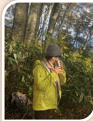
コーヒーが冷え た身体を温め てくれた