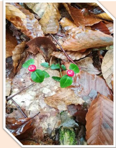
赤いツルアリドウシの果実