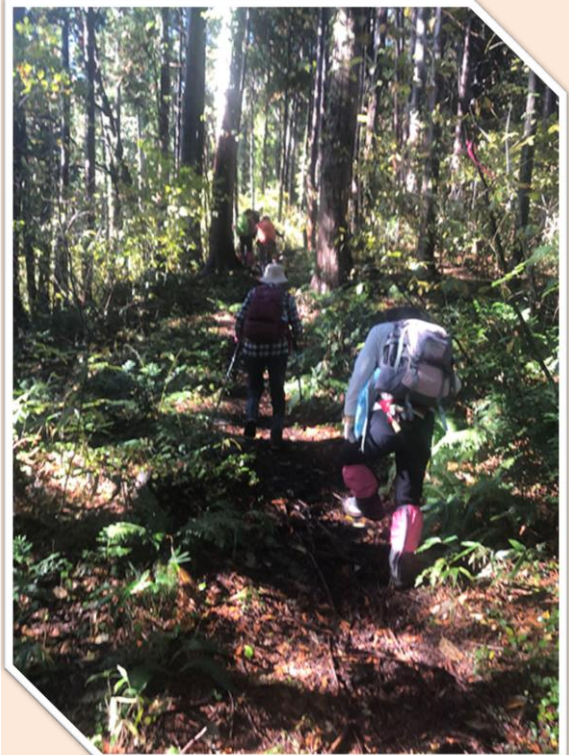
陽に映えるブナ林の中をゆっくりと登る

急登を登り、10時半着替えも兼ねて小休止する。陽に当たったブナの黄色、ナナカマドの赤い実、ダケカンバの白い肌、下を見れば、赤いツルアリドウシの果実には、おへその様なガクの跡が2個見えるのは、花が2本あったからです。覚えにくい名前なので、何回も声に出しながら女子たちは歩きました。そして11時10分、頂上へ着きました。