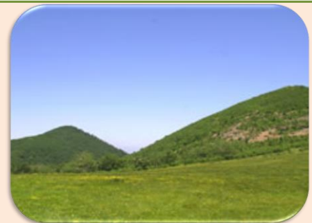
遠別岳（とおべつだけ） 安家森（あつかもり）

町の最高峰、標高1,235メートルの遠別岳（とおべつだけ）。岩手20名山にも選ばれています。