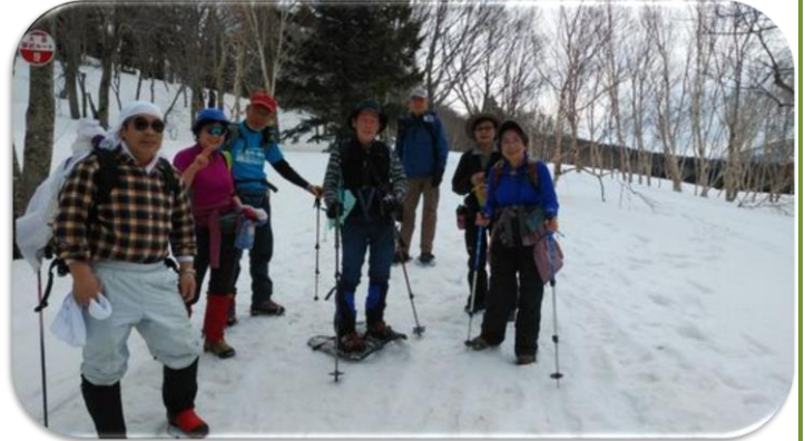
20分感覚でこまめに休憩を取る