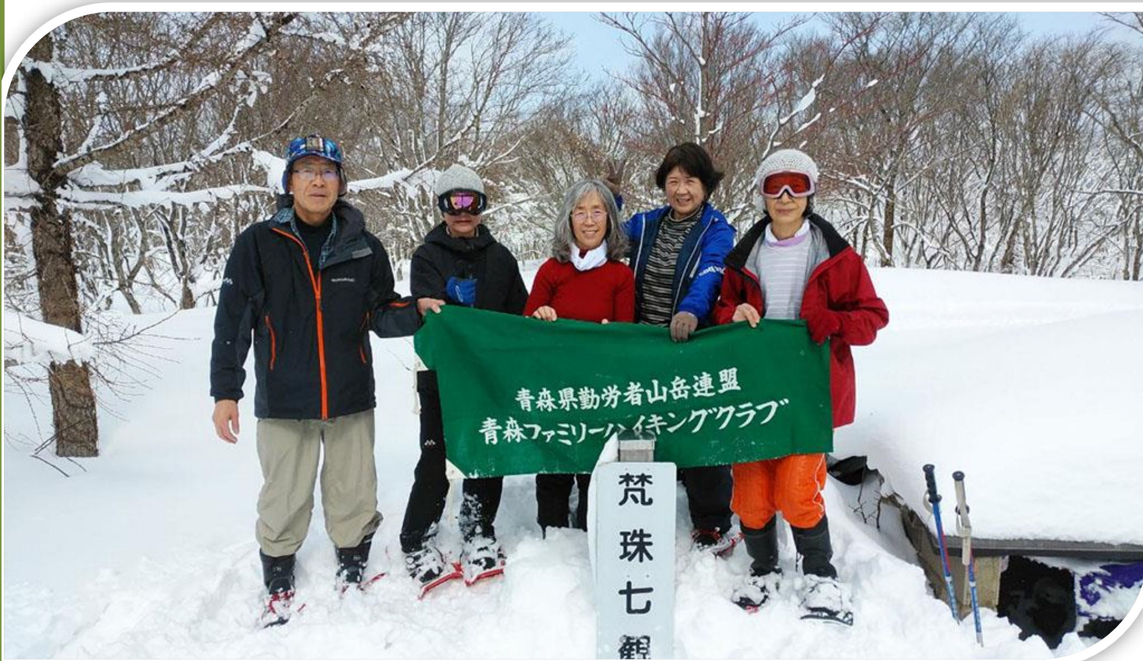
頂上の「梵珠七観音」お堂脇で満足の笑顔