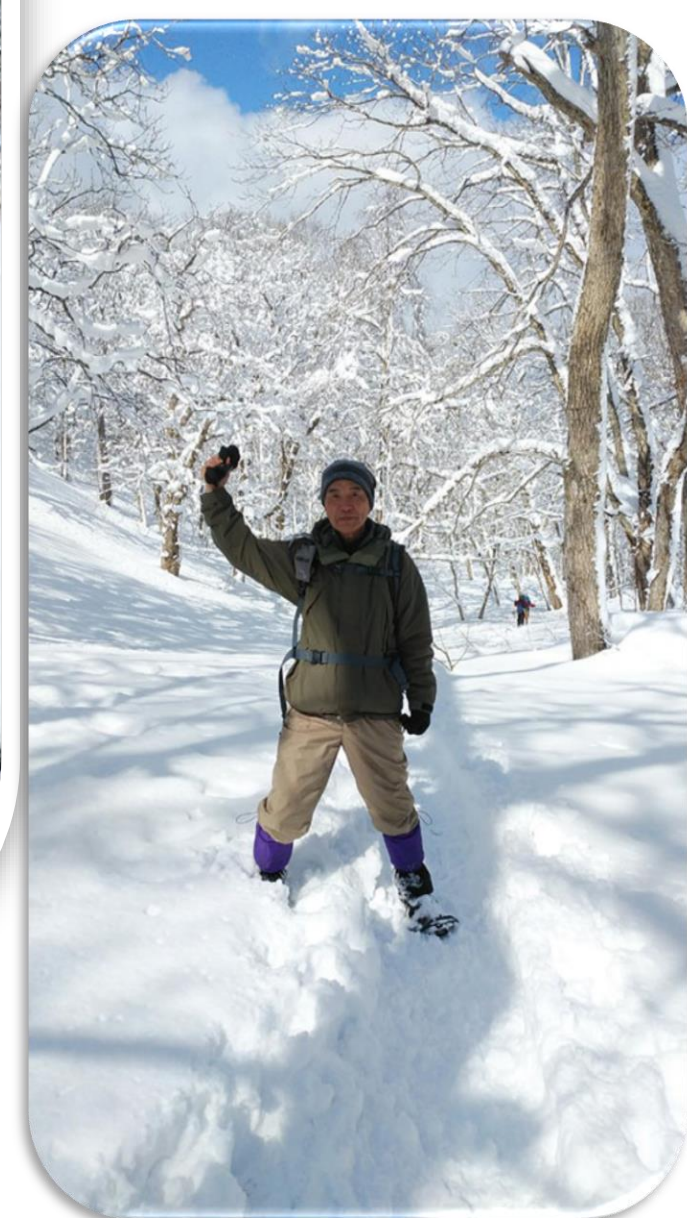
枝に着いた雪が美しい