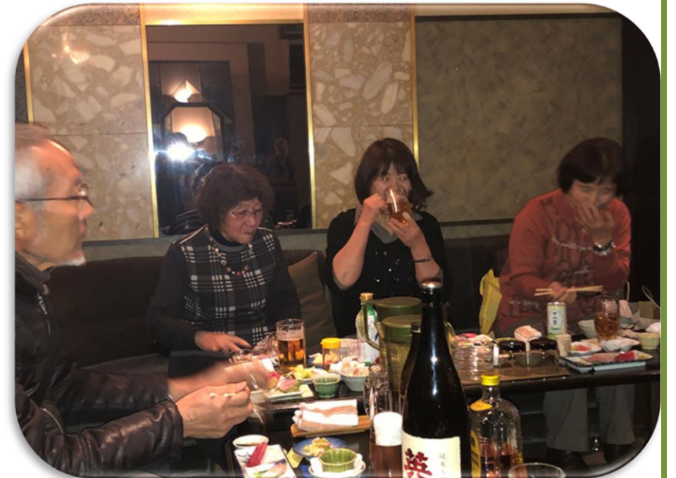
美味しい料理に美味しい生ビール！🍷