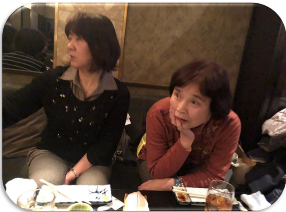
次なに歌おうかな～！