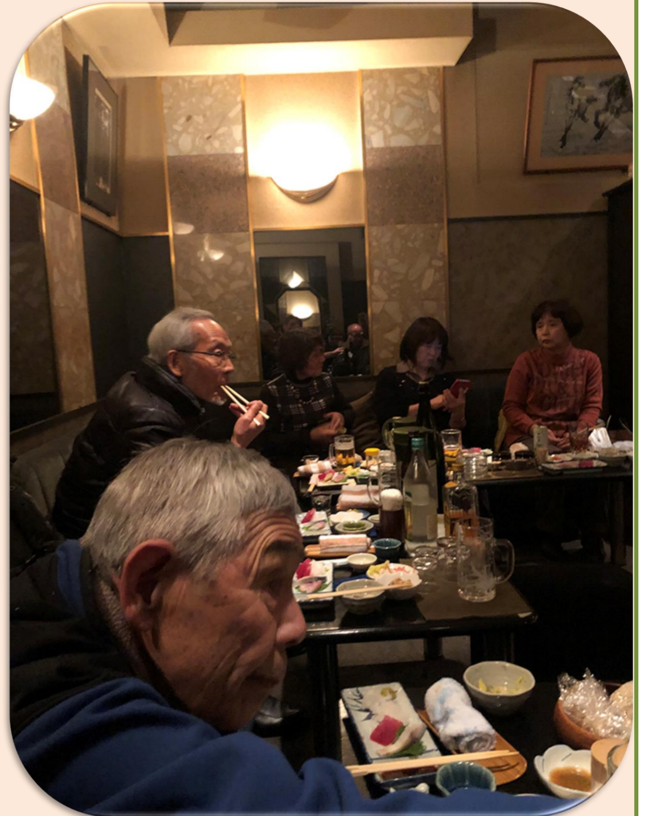
今年登りたい山の話で大いに盛り上がってます！