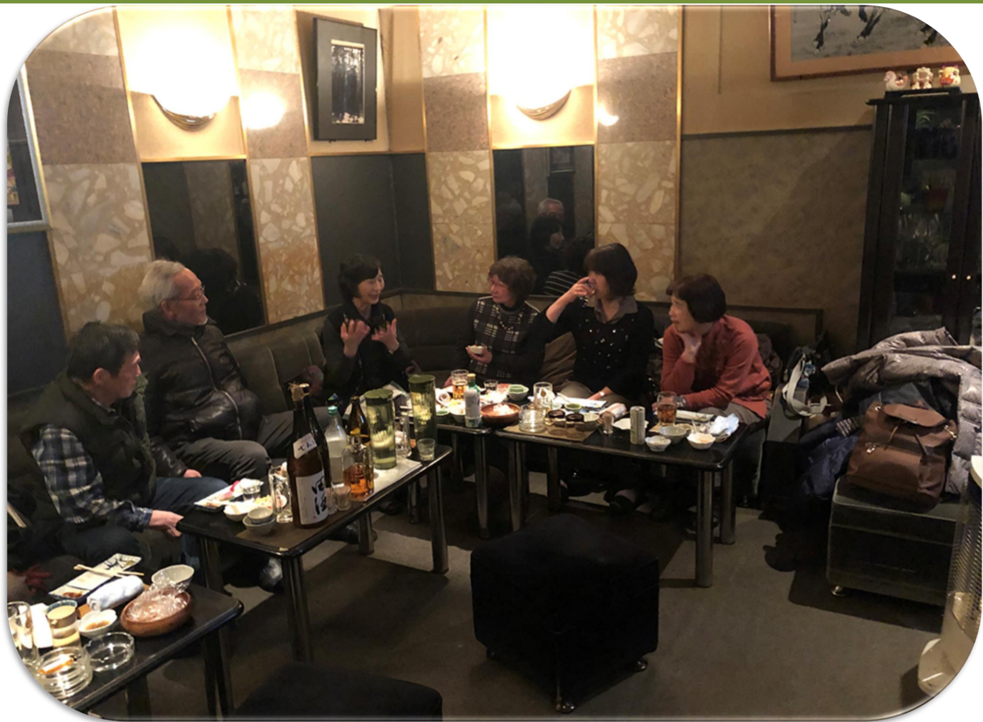
今年度登った山の思い出話に花が咲いています