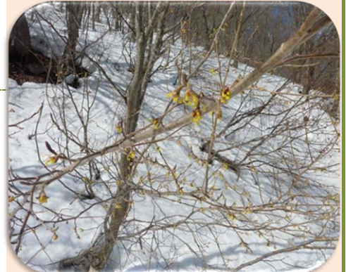
万作の花に春の訪れを感じる

ドーム型の特徴的な姿の黒森山は、無線の要衝だ。NTTをはじめ、さまざまな無線中継アンテナが立っている。中腹にある浄仙寺の背後には、黒石市ゆかりの文学者の碑が並び、「文学の森」として黒石市民らから親しまれている。碑は1962年から建てられ、これまで秋田雨雀、丹羽洋岳、鳴海要吉、柴田久次郎らの碑が建てられた。