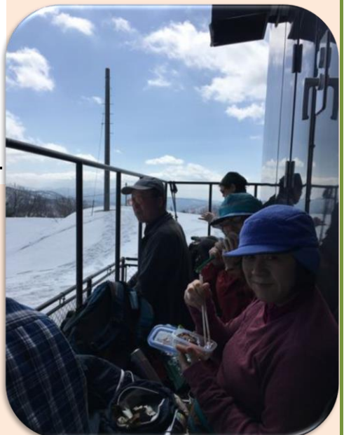
至福の昼食&コーヒータイム